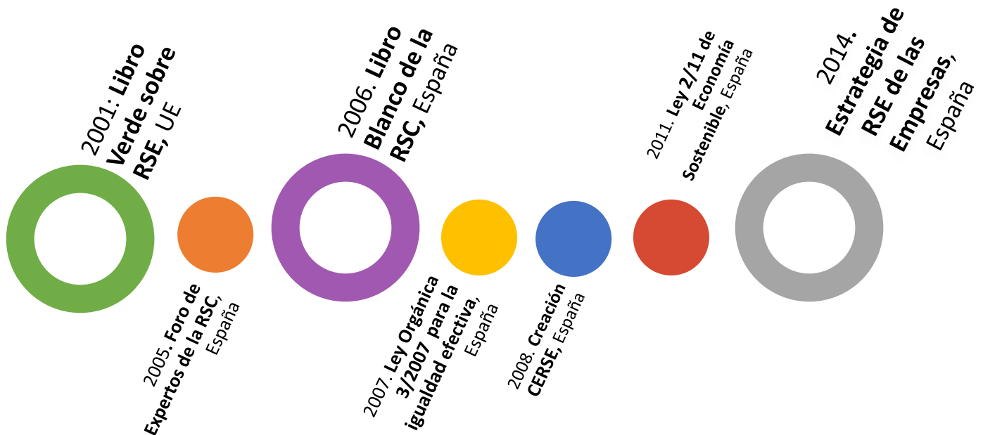
Gráfico: Principales hitos RSE en España